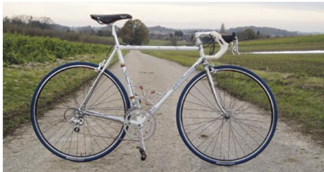
Tommasini Tecno Custom

Sleutelen gebeurde vroeger veelal 's nachts als de coureurs sliepen. De Pinella is heel modern TIG-gelast, dus er zijn geen lugs te bekennen, alleen lasrupjes. De achtersvorken zijn gesoldeerd met de achterpatjes. Wel heeft