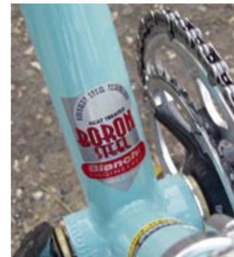
Triple butted staal, TIG-gelast

Beiden frames zijn van staal, de meetwaarden