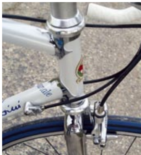
Blinkend chromen lugs...